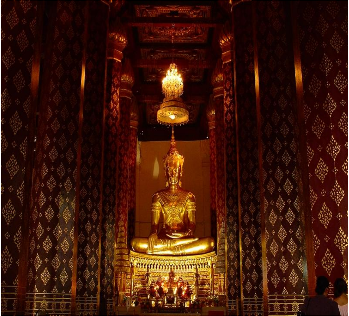
พระพุทธรูปนิมิต