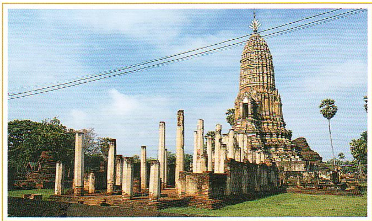
พระปรางค์ วัดพระศรีรัตนมหาธาตุเชลียง จังหวัดสุโขทัย

ในกลางพุทธศตวรรษที่ ๑๘ ขอมได้แผ่อำนาจเข้ามายังดินแดนที่เป็นประเทศไทยปัจจุบันอีกครั้งหนึ่ง เพราะมีกษัตริย์ที่เข้มแข็งและมีความสามารถ คือ พระเจ้าชัยวรมันที่ ๗ (พ.ศ. ๑๗๒๕ - ๑๗๖๑) ทำให้ขอมมีอำนาจเหนืออาณาจักรต่างๆ และคนไทยก็ต้องอยู่ภายใต้การปกครองของขอมด้วย แต่คนไทยก็พยายามที่จะมีอิสรภาพอยู่เสมอ ซึ่งกษัตริย์ขอมก็ทราบดี จึงใช้วิธีการผูกมัดน้ำใจของผู้นำคนไทย โดยยกพระราชธิดาคือ พระนางสีขรมหาเทวี ให้อภิเษกกับพ่อขุนผาเมือง พระราชโอรสองค์ใหญ่ ของพ่อขุนศรีนาวนำถุม ผู้นำชนชาติไทยแถบลุ่มน้ำยม และน่าน พร้อมทั้งพระราชทานพระขรรค์ชัยศรีและตำแหน่งอันเป็นเกียรติคือ “กมรเต็งอัญศรีอินทรปตินทราทิตย์” ให้พ่อขุนผาเมืองอีกด้วย แต่ผู้นำของไทยก็ไม่ได้หลงชื่นชมสิ่งที่กษัตริย์ขอมมอบให้กลับรวบรวมกำลังกันขับไล่อำนาจของขอมออกไปได้สำเร็จและตั้งอาณาจักรสุโขทัยขึ้นเมื่อ พ.ศ. ๑๗๙๒