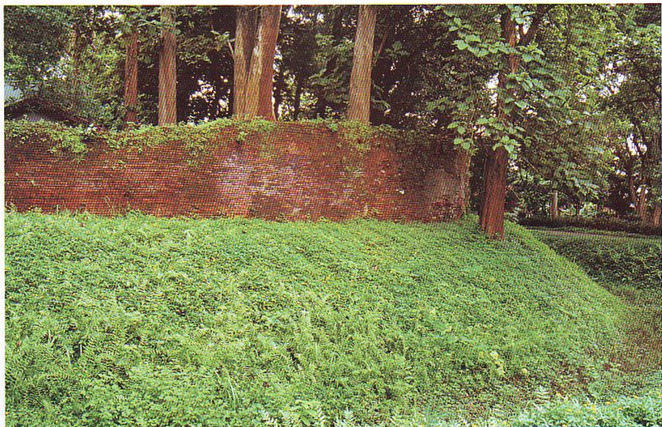
บริเวณกำแพงเมืองเชียงแสน