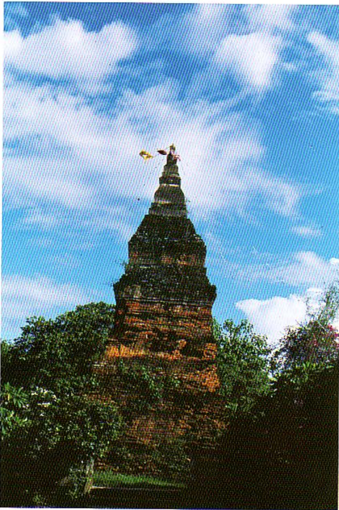
เจดีย์พระนางสิงขรมหาเทวี

หลังจากได้สถาปนาพ่อขุนบางกลางท่าว และพระนางเสือง ขึ้นเป็นกษัตริย์ ครองกรุงสุโขทัยแล้ว พ่อขุนผาเมืองได้รวบรวมไพร่พลยกทัพกลับเมืองราด เมืองที่ พระองค์มุ่งหวังจะได้สร้างบ้านแปงเมือง ให้เป็นที่อยู่ของพระองค์จนสิ้นอายุไข แต่เมื่อ เสด็จกลับถึงเมืองราด ความทราบถึงพระนางสิงขรมหาเทวี พระนางสิงขรทรงพิโรธ พ่อขุนผาเมืองเป็นอย่างมาก ตัดพ้อหาว่าทรยศต่อพระราชบิดา (พระเจ้าชัยวรมันที่ ๗) ของพระนาง และรบเร้าให้พ่อขุนผาเมืองยกทัพกลับไปตีเมืองสุโขทัยคืนมา พ่อขุนผา เมืองมิยินยอม ไม่ว่าพระนางสิงขรจะอ่อนวอนอย่างไร สร้างความโกรธเคืองแก่ พระนางอย่างยิ่ง ฤทธิโกรธนั้นรุนแรงนัก บวกกับความน้อยพระทัย พระนางสิงขร