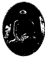
หลวงพ่อดำสิงดำ