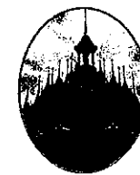
วัดท่าซุง