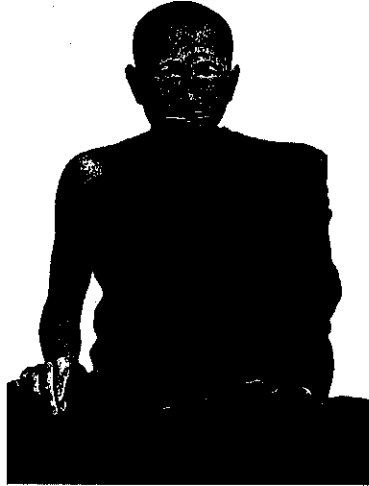
หลวงพ่อบาน