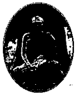
หลวงพ่อบุญศรี

ขอให้ท่านพุทธบริษัททั้งหลายช่วยกันพิจารณาด้วยปัญญา ที่แท้ จริง เหาะระบบการเมืองเข้ามาเทียบเคียงกับความจริง แล้วจะ ทราบความจริงต่อไปในวันข้างหน้า เอากันแค่นี้ก็พอ