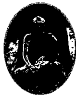
หลวงพ่อกุญชรลีลา