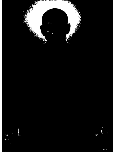
หลวงพ่อกุญชรลีลา