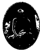
หลวงพ่อดำสิงดำ

๑. มหาภาพผ่านมหายักษ์ ๒. รู้จักรธรรม ๓. จำต้องคิด ๔. สนิทธรรม ๕. จำแขนขาด ๖. ราษฎร์ราชาโจร ๗. นั่งทน ทุกข์ ๘. ยุคทมิฬ ๙. ถิ่นกาขาว ๑๐. ชาววิไล