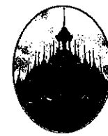
วัดท่าซุง