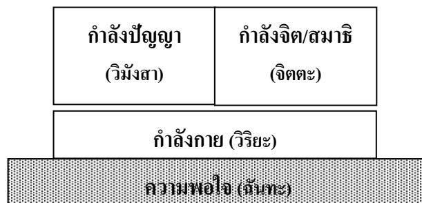
แผนภูมิที่ ๑ ความสัมพันธ์ระหว่างองค์ธรรมในหมวดอิทธิบาท ๔

๑. อิทธิบาท ๔ เป็นองค์ธรรมที่สำคัญ ที่สามารถนำมาใช้เป็นกรอบในการพัฒนาได้เป็นอย่างดี โดยมี ฉันทะ (ความพอใจ) เป็นฐาน วิริยะ (ความเพียร) เป็นที่ตั้ง และ จิตตะ (หรือ “กำลังสมาธิ” : ความคิด) วิมังสา (หรือ “กำลังปัญญา” : ความไตร่ตรองหรือทดลอง) เป็นยอด และมีกรอบความสัมพันธ์ ดังแสดงในแผนภูมิที่ ๑ ดังนี้