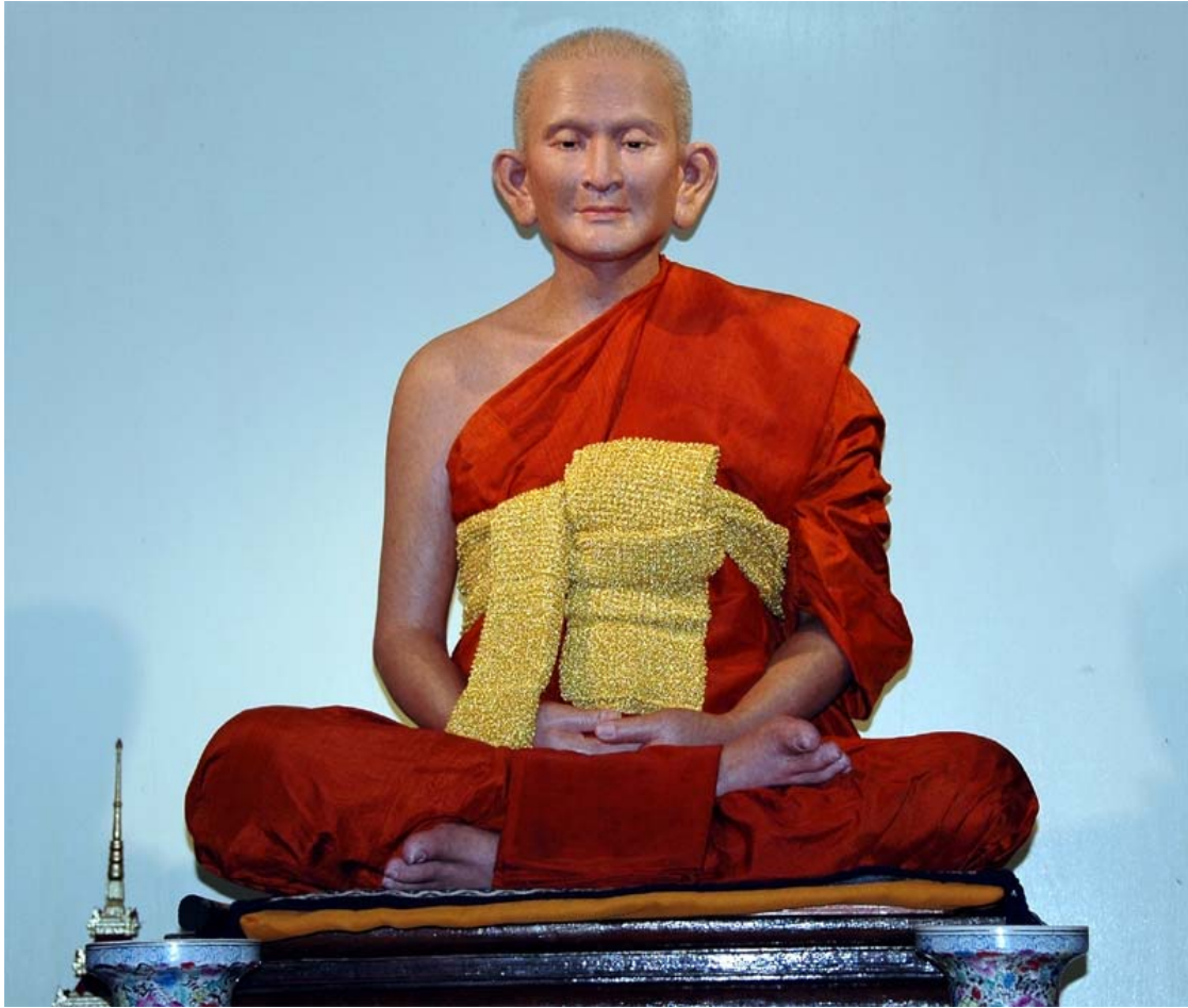
พระประวัติสมเด็จพระสังฆราชญาณสังวร มหาเถรเจ้า (ลูกไก่เถื่อน)

บรมครูฝ่ายวิปัสสนาธุระ ประจำยุครัตนโกสินทร์ และพระธรรมทายาท วัดราชสิทธิาราม วรวิหาร (พลับ) ศูนย์กลางพระกรรมฐานมัชฌิมา แบบลำดับ ประจำยุครัตนโกสินทร์