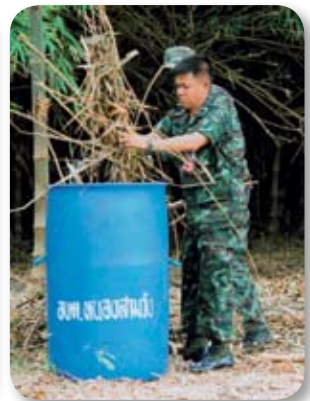
วันเตรียมงาน